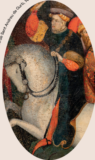
Compartiments del retaule de Sant Andreu de Gurb, 1415 - 1418

El arte de la edad media utilizó a los animales para expresar visiones del mundo y de la existencia humana fuertemente marcadas por el