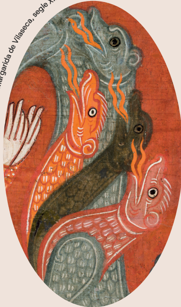
Frontal d'altar de Santa Margarida de Vilaseca, segle XII

À partir de la richesse des collections du MEV, cette exposition illustre différents aspects, modalités et intentions de la présence foisonnante des animaux dans l'art médiéval, tout en nous rapprochant de la manière de penser et de vivre des hommes et des femmes du Moyen Âge.